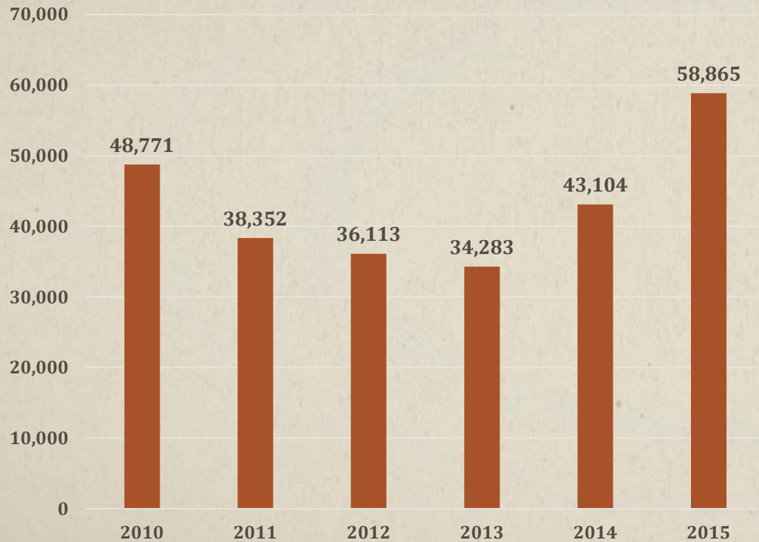
연도별 중국상표 이의신청 건수 추이